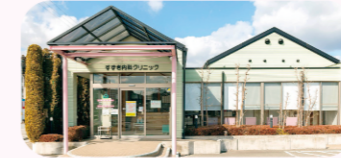
すずき内科クリニック

当院の得意としているところとして 喘息・アレルギーと漢方診療 があります。 アレルギー症状や長引く咳でお困りの方、また漢方診療に興味がある方はご相談下さい。